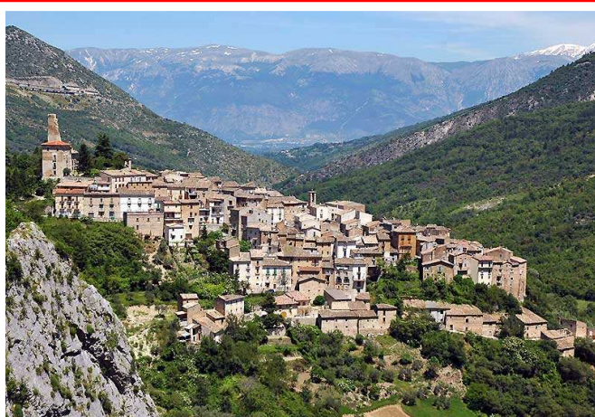
Anversa Degli Abruzzi

farvi ingoiare dalla natura selvaggia o visitare i pittoreschi borghi di Castrovalva (deviazione di pochi km dalla strada principale, con ritorno obbligato), di Villalago (ci si passa accanto), o della più famosa